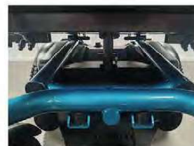
Eje delantero pivotante